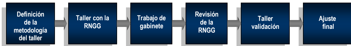
Figura 1. Fases para la elaboración de los planes

La metodología propuesta para la elaboración de los planes se desarrollará en 6 fases las cuales se ilustran en la siguiente figura: