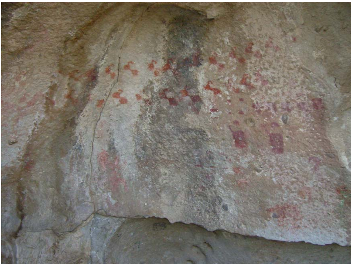
Detalle del “Panel Boman”, Cerro de las Pinturas, Pucará de Rinconada.

En este contexto deben destacarse las varias representaciones plásticas reconocidas en el Cerro de las Pinturas inmediato al Pucará de Rinconada. Se identifican imágenes de personajes vestidos con “unkus” que llevan diseños propiamente incaicos (“llave incaica”) y el Panel Boman que parece mostrar el encuentro de grupos de diversas etnias, a juzgar por los diferentes tipos de vestimentas y tocados, flanqueados por el ejército incaico y en presencia de dignatarios estatales.