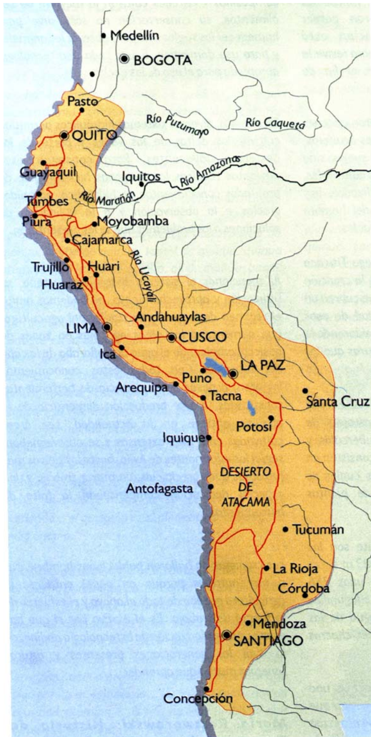
— Caminos del Tawantinsuyu ● Ciudades actuales ○ Capitales actuales

último punto ascendía al abra que separa a la Puna de la Quebrada del Toro. Desde allí el camino continuaba hacia los grandes valles del Noroeste Argentino: Lerma, Calchaquí, Santa María, Hualfín y Abaucán para alcanzar Copiapó por el paso de San Francisco o siguiendo por las actuales provincias de La Rioja, San Juan y Mendoza hasta llegar al centro de Chile por Uspallata u otros pasos en la cordillera.