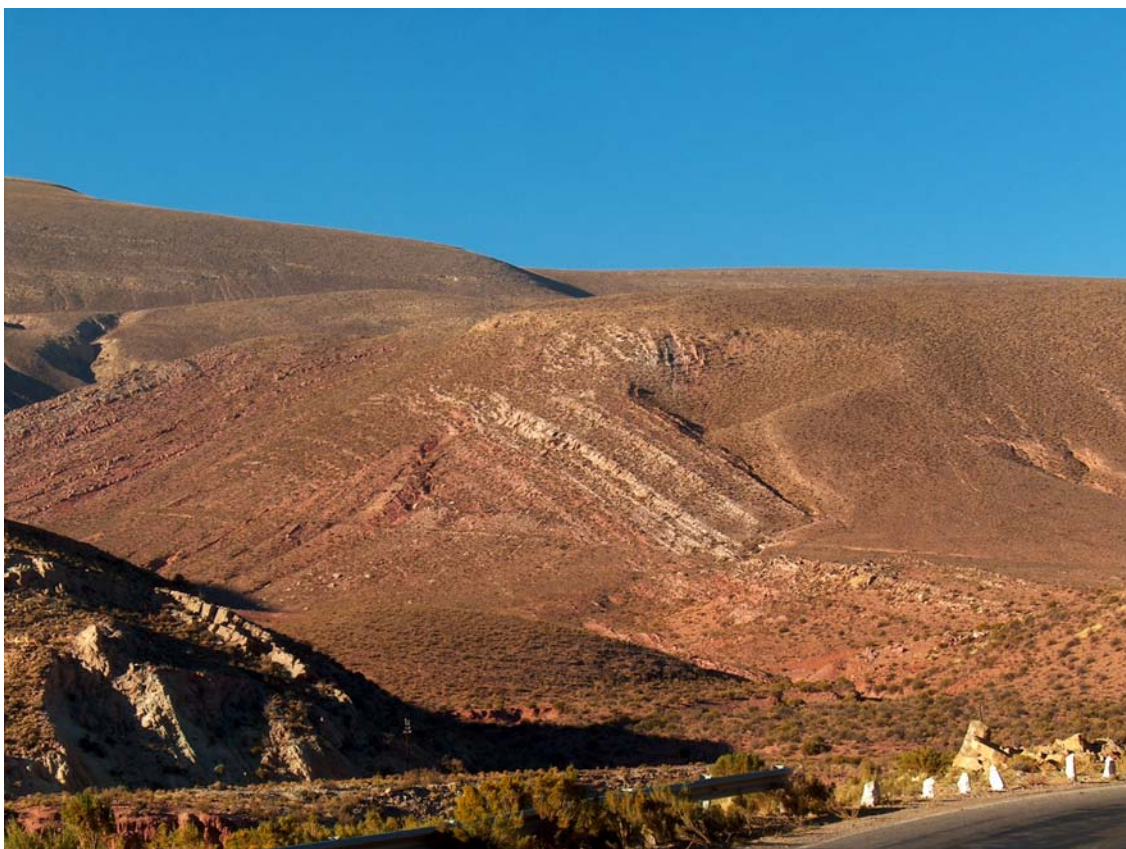
Camino Inca en Esquinas Blancas

El otro camino incaico importante que pasaba por la Puna de Jujuy ingresaba al actual territorio argentino cerca de La Quiaca para dirigirse hacia un tambo que se encontraba cerca de La Quiaca Vieja. No se sabe exactamente por dónde continuaba en su recorrido hacia Cangrejillos pero desde allí tomaba por la parte baja del faldeo serrano hasta Tres Cruces desde donde se dirigía hacia Esquinas Blancas, Inca Cueva, Sapagua y siguiendo la Quebrada de Humahuaca hasta San Antonio (cerca de Perico) desde donde enlazaba con el Valle de Lerma. Desde este camino se desprendían varios ramales hacia el este como Iruya, Rodero - Coctaca, Calete - Cianzo - Zenta, Capla - Caspalá - Santa Ana - Valle Colorado - Valle Grande y otros.