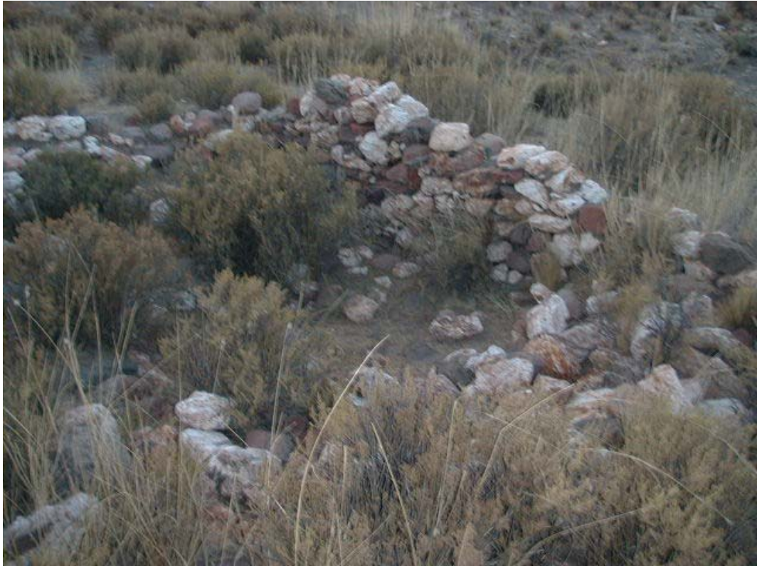
Restos de un recinto en el Tambo Real de Calahoyo