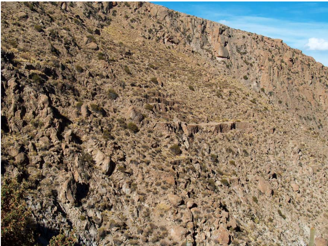
Andenes incaicos en Puerta de Tucute

Capinte y Puerta de Tucute, particularmente los dos últimos. En el caso de Capinte , al noreste de Casabindo, se trata de una serie de 6 andenes realizados con una extrema prolijidad, rodeados por otras series menos elaboradas. A esto se suma la identificación de fragmentos de cerámica incaica en la superficie de los mismos. Al suroeste de Casabindo, sobre el faldeo norte de Puerta de Tucute , se reconoce una serie de andenes en gradería construidos sobre una marcada pendiente. Entre ellos se destaca un andén de gran tamaño de elaboración sumamente prolija (5,70 m de alto x 6 m de ancho x 40 m de largo) sobre una pendiente de 45 grados. En relación a Sayate Oeste , lo notable es la gran dimensión del sistema de andenes, que ocupa la mitad baja de un faldeo y cuenta con un canal de riego en su parte superior. Las dimensiones de la obra, planeadas y ejecutadas como un conjunto, son de indudable factura incaica.