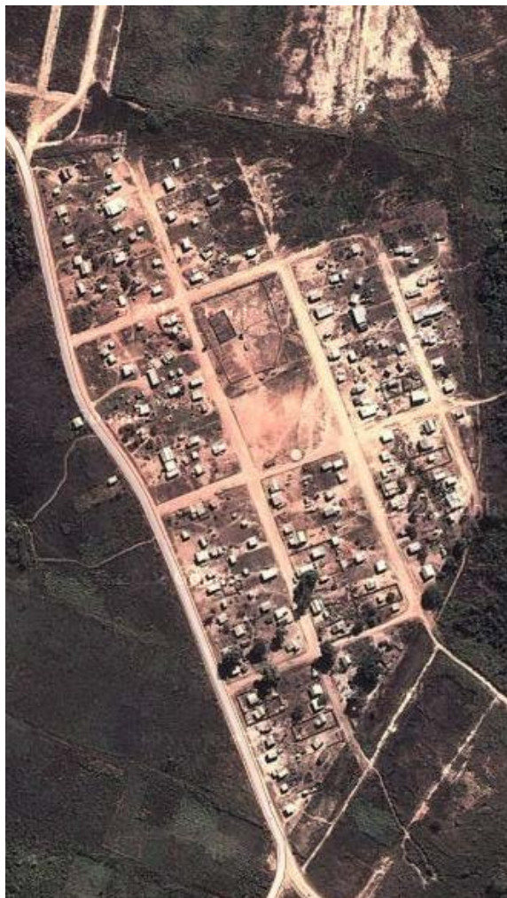
Barrio 6 de Agosto