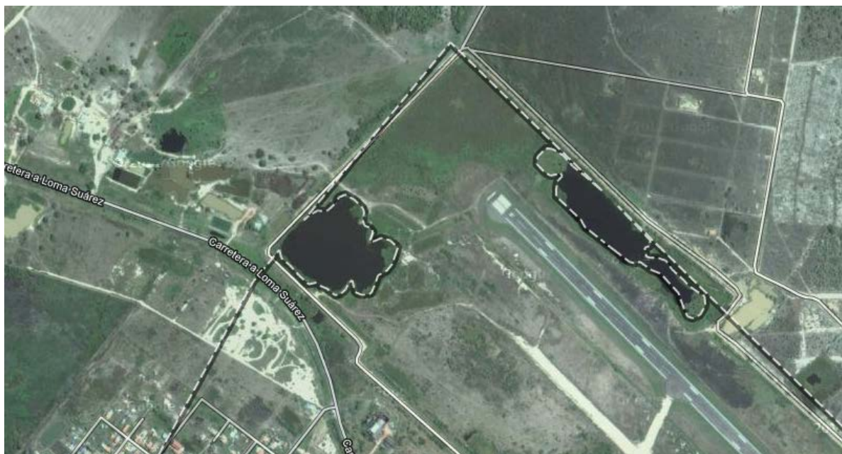
Pozas artificiales en el perímetro del aeropuerto