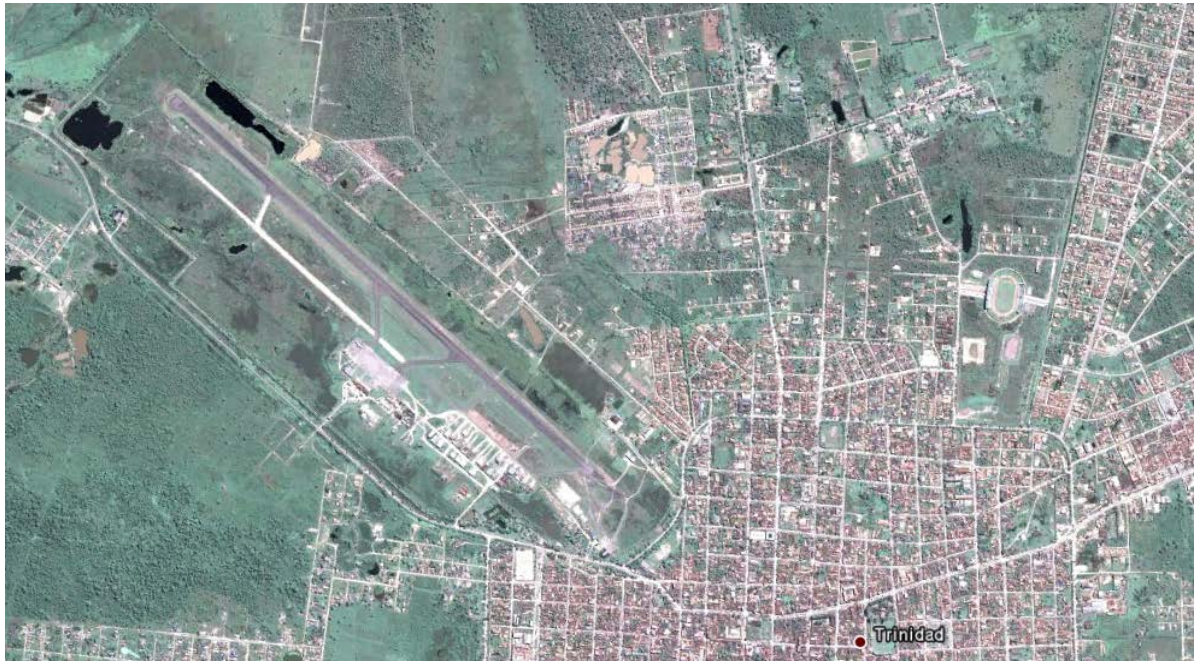
Ubicación del aeropuerto