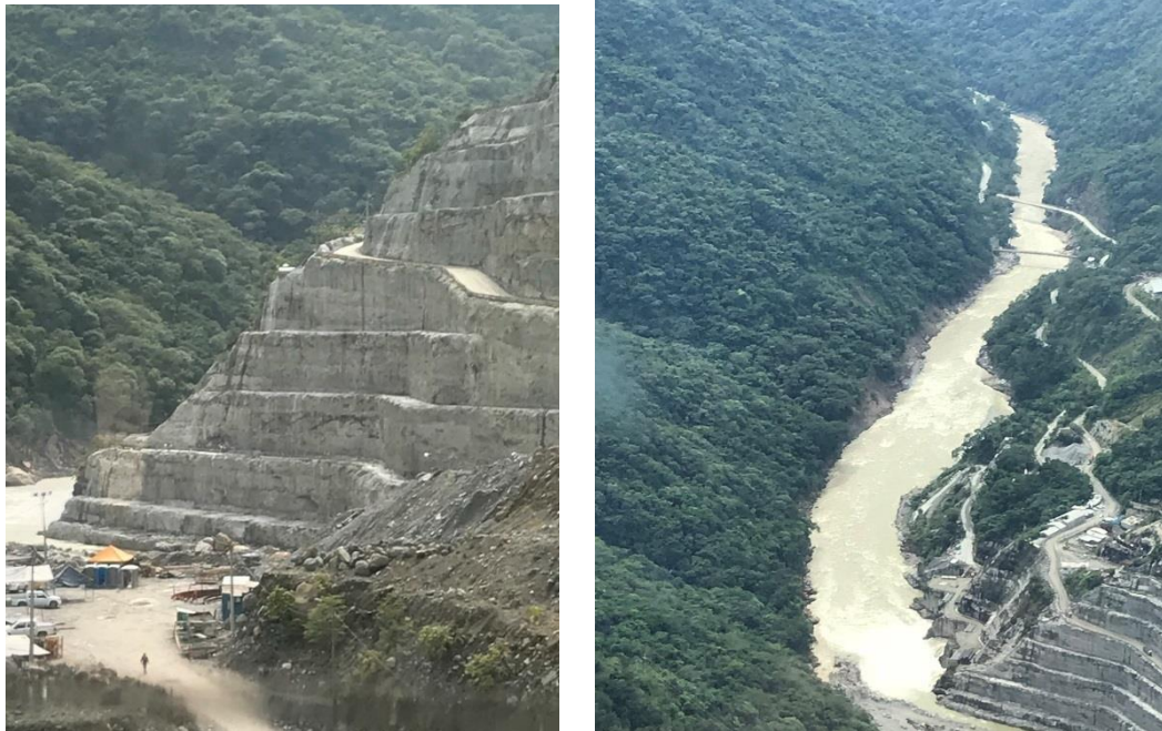
Imágenes obtenidas por el MICI durante la misión de agosto de 2018