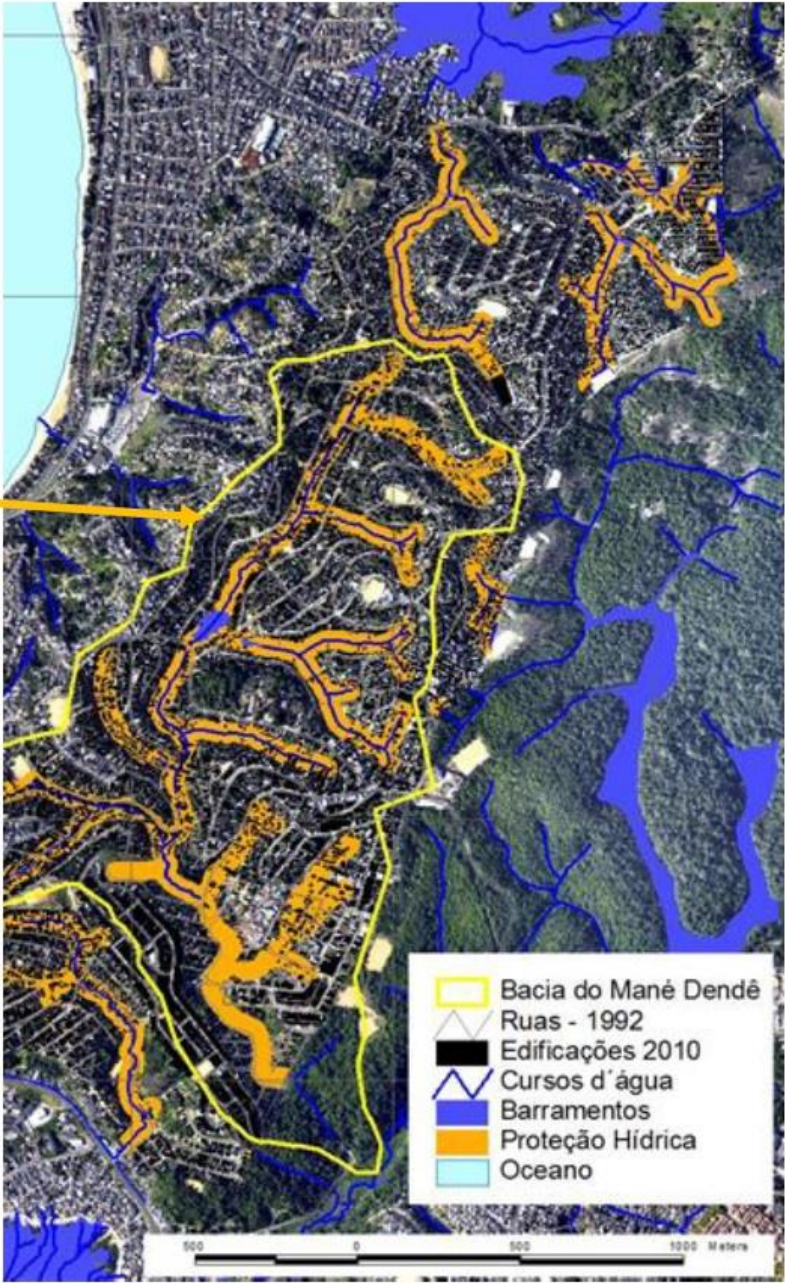
FIG. 3: Cuenca del río Mané Dendé