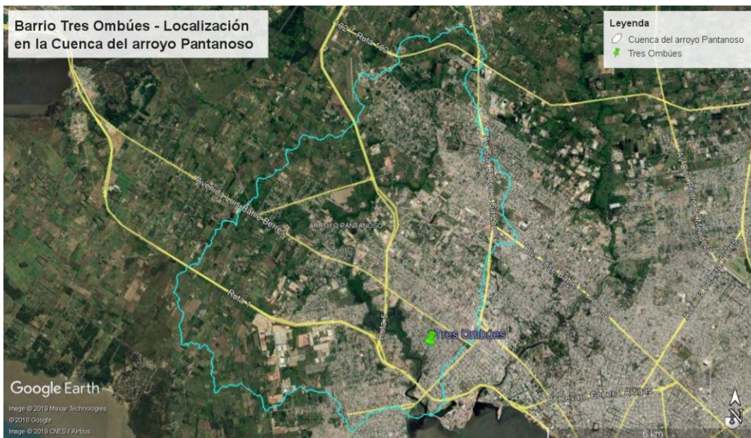
Figura 1: Localización del barrio Tres Ombúes dentro de la Cuenca del arroyo Pantanoso, Montevideo, Uruguay 1 .